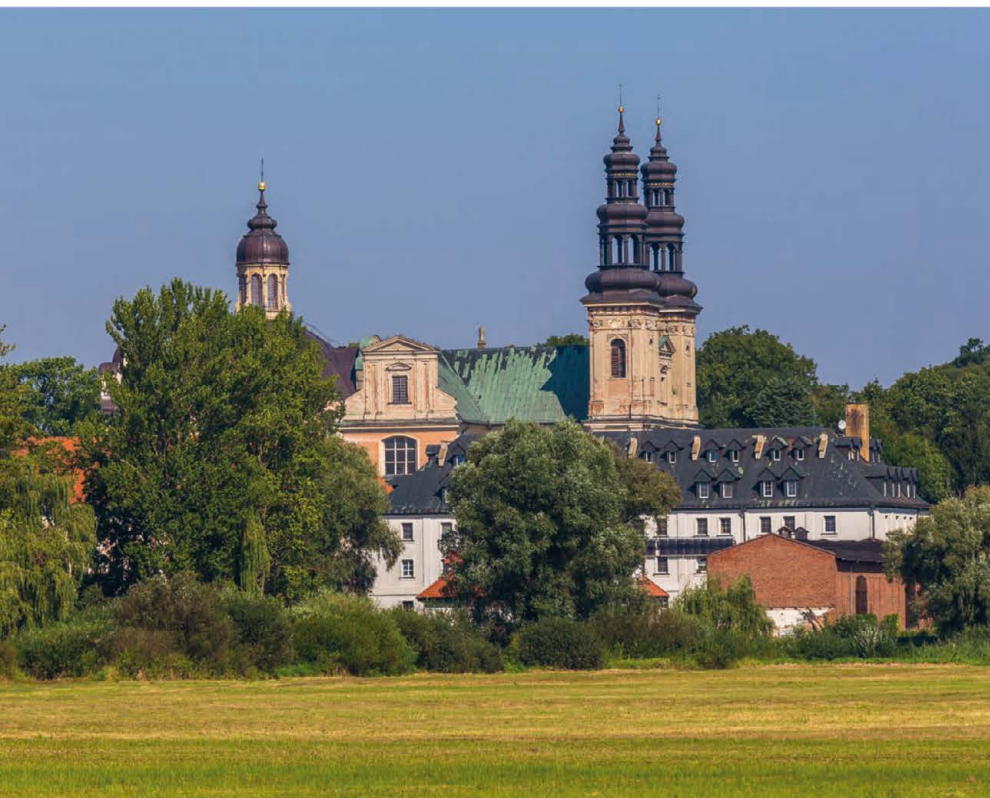
▲ Opactwo Cystersów w Łądzie