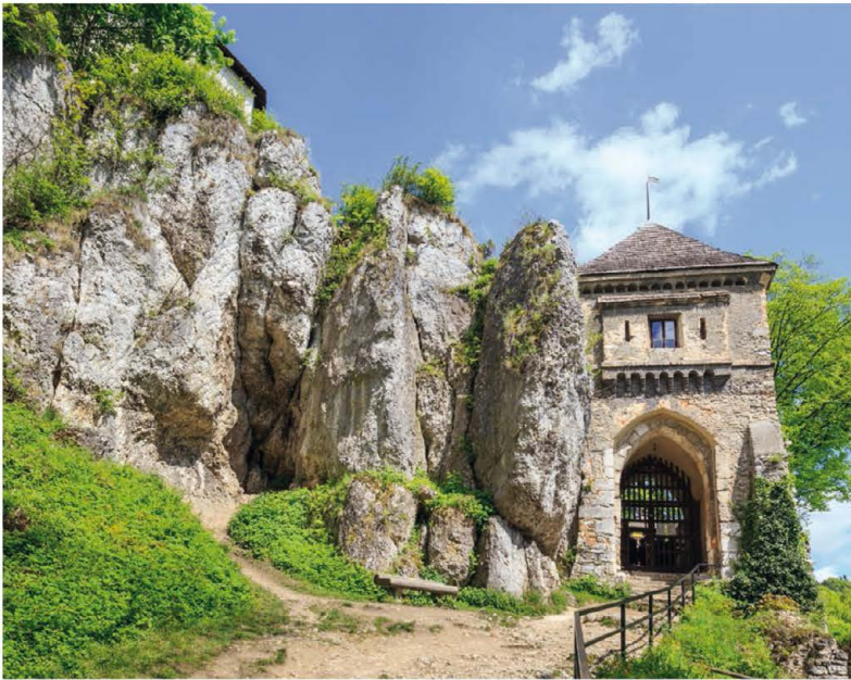
↗ Wieża ojcowskiego zamku

choć nieprzystosowana do zwiedzania Jaskinia Łabajowa i zwiedzana z przewodnikiem Jaskinia Nietoperzowa .